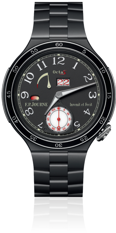
Automatique Réserve Réf. ARS2