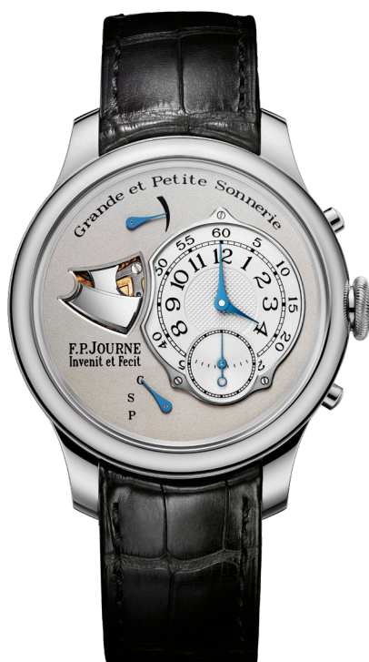
Sonnerie Souveraine Réf. GS