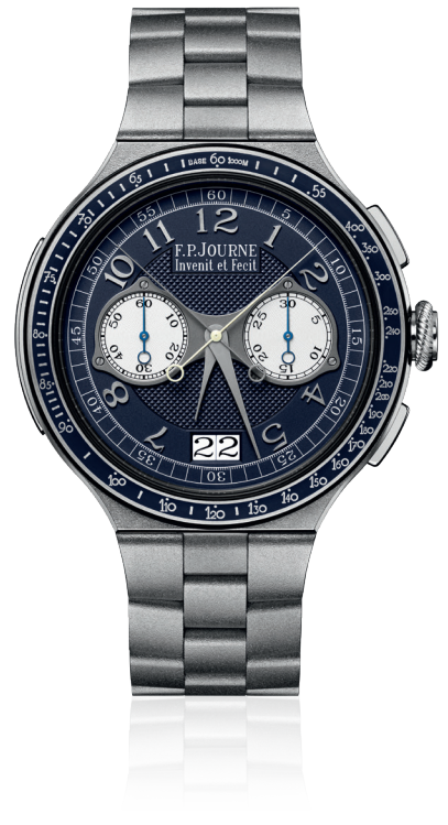
Chronographe Rattrapante Réf. CM

La collection lineSport propose des montres au caractère sportif contemporain, intégrant des complications horlogères de haut vol. L'Automatique Réserve, le Centigraphe et le Chronographe Rattrapante sont disponibles en version ultra-légère avec boîtier et bracelet en Titane associés à un mouvement en Aluminium. Ils se déclinent également en Platine et en Or 6N 18 ct., avec un bracelet en métal assorti et un mouvement en Or rose 18 ct. Dernière création à rejoindre cette collection, le Chronomètre Furtif inaugure un boîtier et bracelet en Carbure de Tungstène, un matériau inédit chez F.P.Journe, exclusivement associé à un mouvement en Or rose 18 ct.