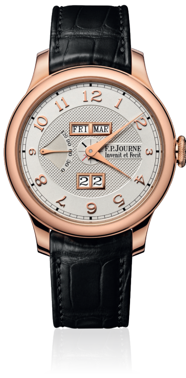
Quantième Perpétuel Réf. QP