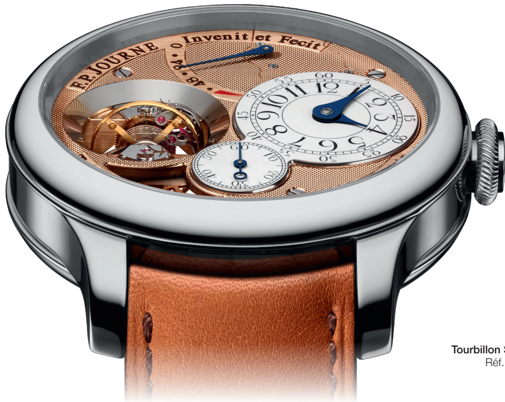
Tourbillon Souverain Réf. TV

Les chronomètres de précision de la Collection Classique résultent de défis horlogers relevés au-delà des limites établies. Tous les calibres mécaniques exclusifs en Or rose 18 ct. sont entièrement conçus et fabriqués en interne. Chaque modèle, qu'il soit équipé d'un mouvement à remontage manuel ou du calibre automatique Octa, est à l'image de la philosophie de F.P.Journe : innover, dans le respect des traditions.