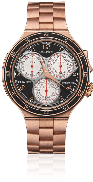
Centigraphe Réf. CT2