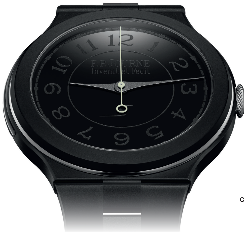
Chronomètre Furtif Réf. CF

La collection lineSport propose des montres au caractère sportif contemporain, intégrant des complications horlogères de haut vol. L'Automatique Réserve, le Centigraphe et le Chronographe Rattrapante sont disponibles en version ultra-légère avec boîtier et bracelet en Titane associés à un mouvement en Aluminium. Ils se déclinent également en Platine et en Or 6N 18 ct., avec un bracelet en métal assorti et un mouvement en Or rose 18 ct. Dernière création à rejoindre cette collection, le Chronomètre Furtif inaugure un boîtier et bracelet en Carbure de Tungstène, un matériau inédit chez F.P.Journe, exclusivement associé à un mouvement en Or rose 18 ct.