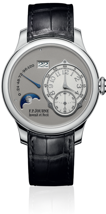
Lune Réf. LN

Les chronomètres de précision de la Collection Classique résultent de défis horlogers relevés au-delà des limites établies. Tous les calibres mécaniques exclusifs en Or rose 18 ct. sont entièrement conçus et fabriqués en interne. Chaque modèle, qu'il soit équipé d'un mouvement à remontage manuel ou du calibre automatique Octa, est à l'image de la philosophie de F.P.Journe : innover, dans le respect des traditions.