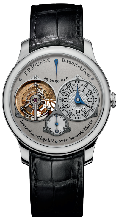
Tourbillon Souverain Réf. TN