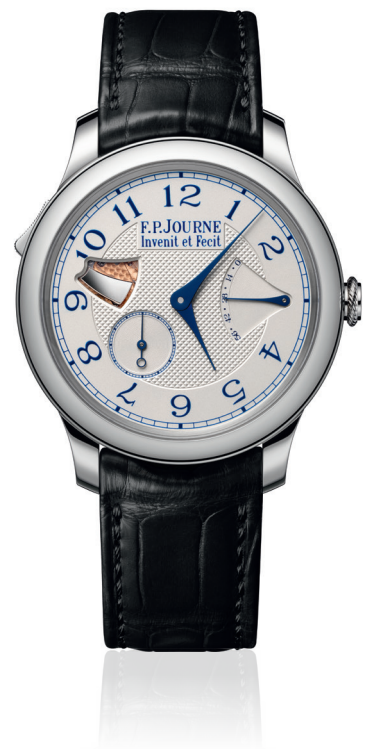
Répétition Souveraine Réf. RM