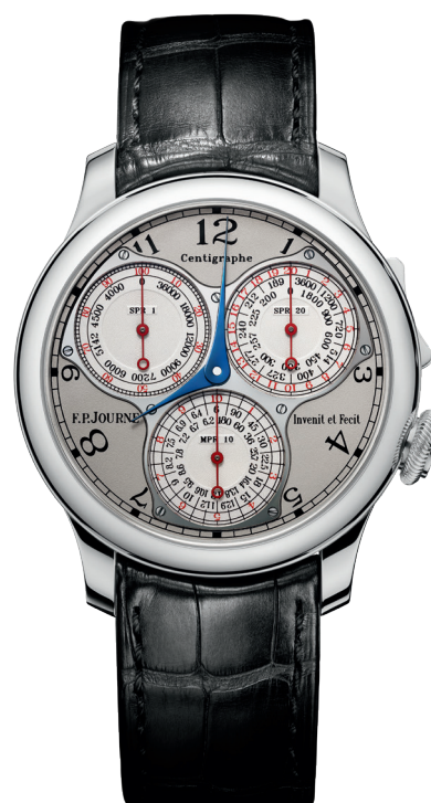
Centigraphe Souverain Réf. CT